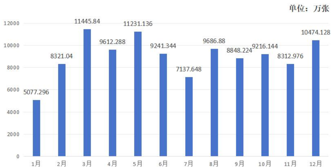
图 2-2 2023 年 1-12 月热敏纸供应情况